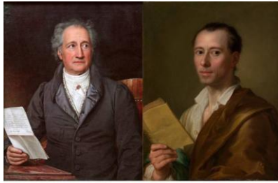
Auch Goethe und Winckelmann waren in Rom