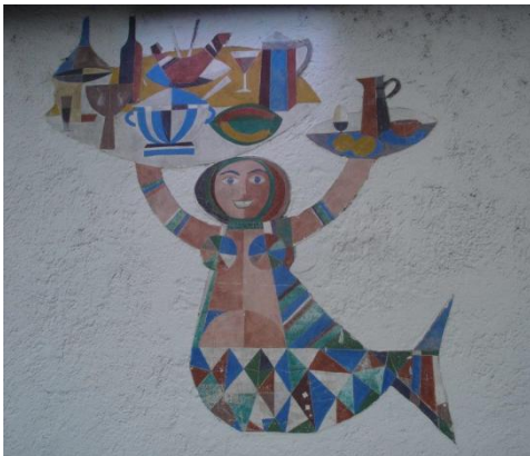
Kay Krasnitzky, Fresko am Haus Imbergstr. 2, Café Bazillus

Dienstag, 10. März 2020 , 18.00, Unipark Nonntal, 2. Stock, SR 2.133