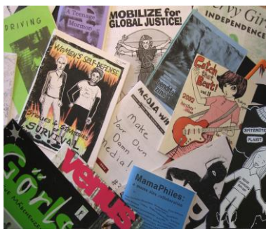
Zinecollage, Elke Zobl, 2019, Zines, Schwerpunkt Wissenschaft und Kunst Salzburg

Dienstag, 18. Juni 2019, 18.00, Unipark Nonntal, 2. Stock, SR 2.132