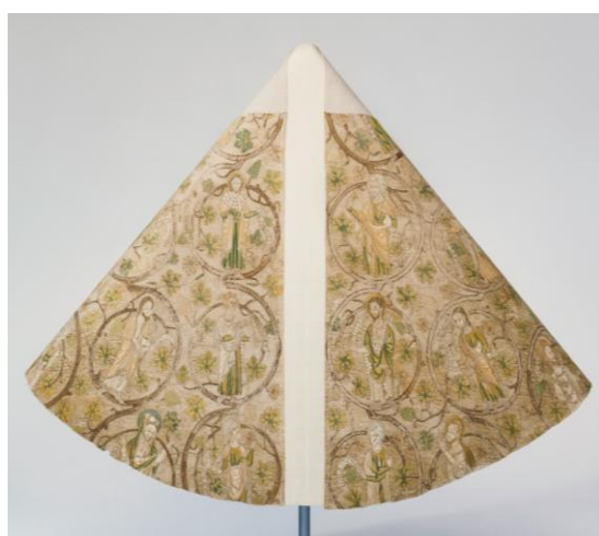
Gesticktes Pluviale aus dem Salzburger Dom, England, Ende 13. Jh. Riggisberg, Abegg-Stiftung

Dienstag, 9. April 2019 , 18.00, Unipark Nonntal, 2. Stock, SR 2.132